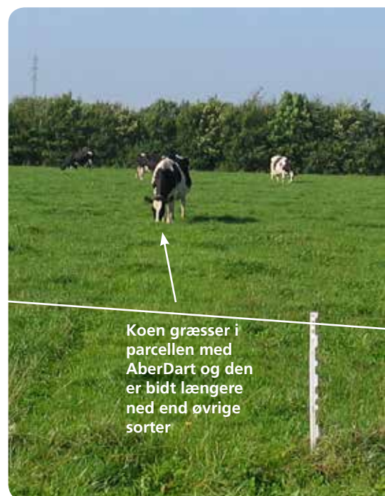
Koen græsser i parcellen med AberDart og den er bidt længere ned end øvrige sorter

AberDart indgår i en række forskellige frøblandinger til såvel afgræsning som slæt. Og har du brug for din egen blanding med AberDart, kan du blot kontakte os.